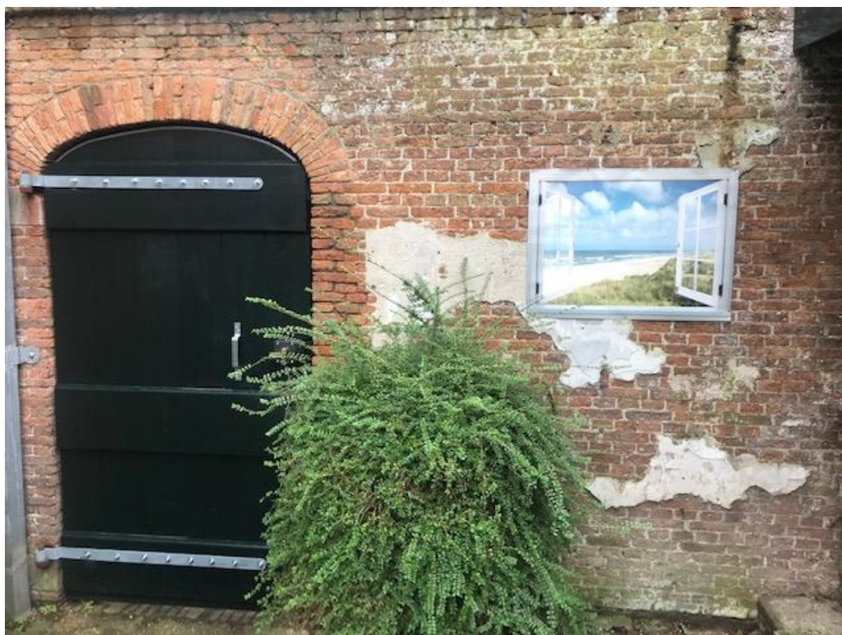
Nieuwe tuindeur en trompe l'oeil.

Stichting Het Hooftshofje Assendelftstraat 89 2512 VT 's-Gravenhage http://www.hooftshofje.nl